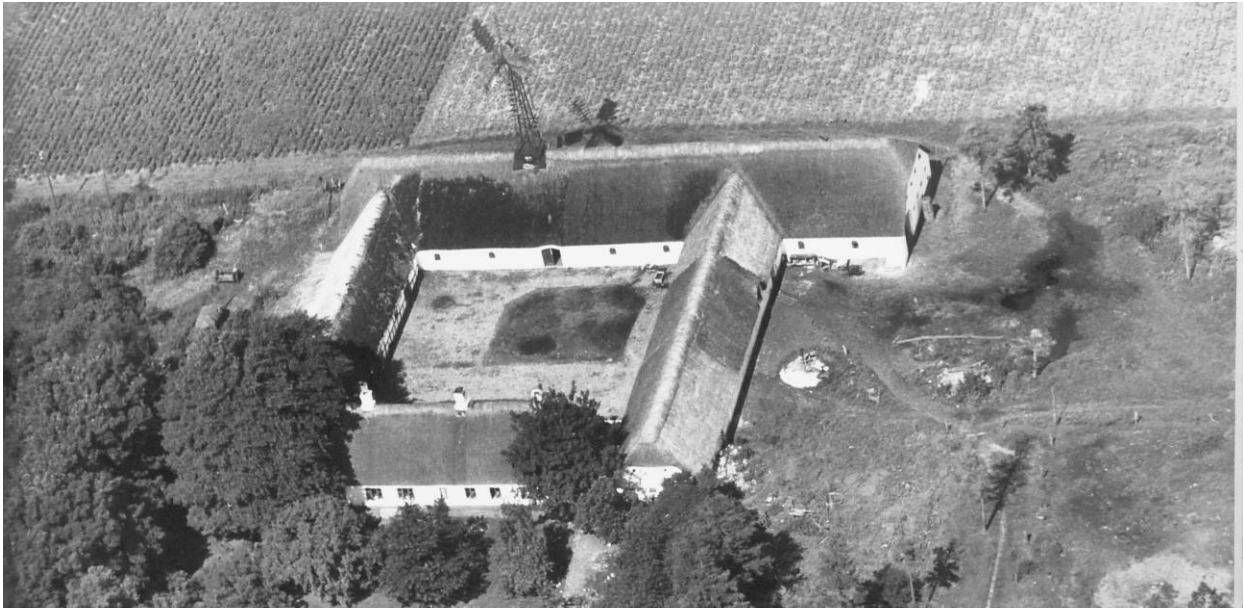
Her ses Øster Kibsgård ca. 1920. Den har matrikel 57 og der er tydelig noget gammelt og noget nyt.

Store dele af det gamle Dronninglund Sogn er hævet havbund siden sidste istid. Langsomt blev den østlige del af sognet land, og efterhånden beboelig. Bolleskov eksisterede ikke andet end som Bollegårdenes overdrevsjorder. De store moseområder vest for Aså blev også efterhånden beboet. Østerled var en gård, og den lå yderst mod det store moseområde. Den var altså det østligste led i Ørsø fjerding. Her går nemlig grænsen til Strandfjordingen, men det vidste man intet om i gamle dage. Her lå aller vestligst på kanten til mosen en bebyggelse kaldet Kibsgård.