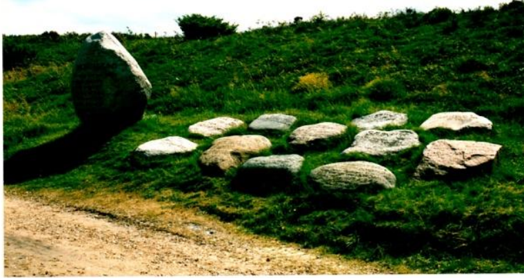
Dronninglund herredssten og sognestene i Kongenshus Mindepark