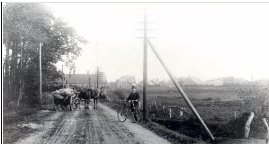
Indkørsel til Dronninglund 1907. Til højre er nuværende Skovvej, til venstre nuværende Skovbrynet.

Den 31. jan. 1895 indviede han Amtssygehuset i Dronninglund. Her ønskede patienterne også deres præsts betjening med besøg af ham af og til. Det fortsatte helt op til for få år siden, at præsten kunne få oplyst om nogle af hans/hendes sognebørn var indlagt og derfor gerne ville have et besøg, men det må man ikke oplyse i dag.