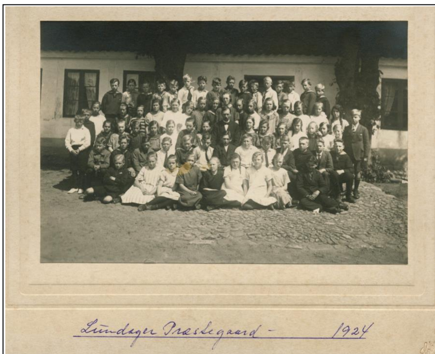
Lundager Præstegård med konfirmander.