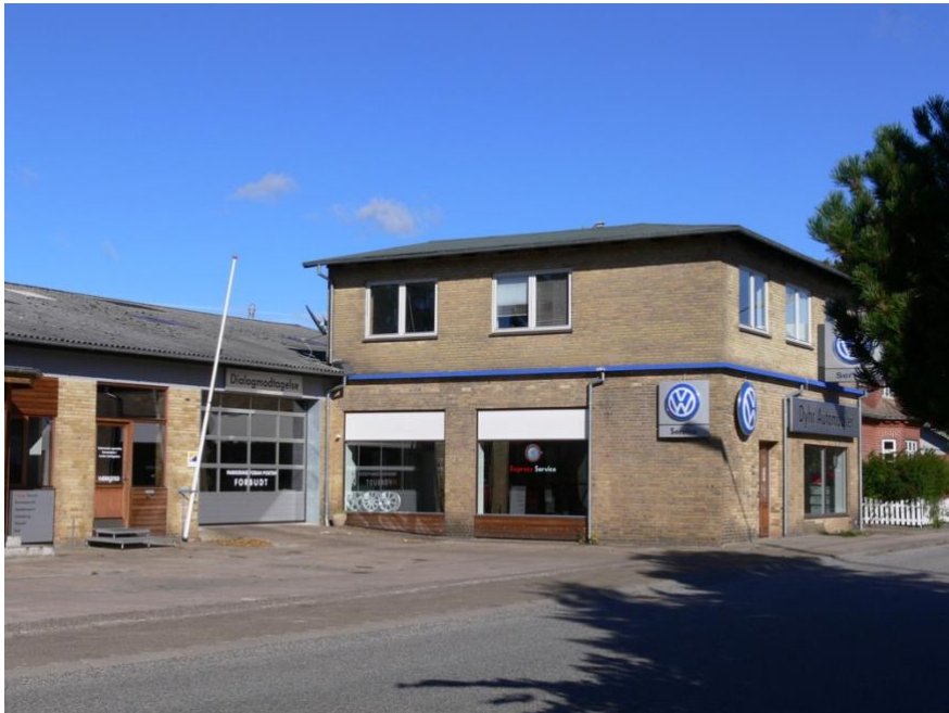
Sandagers bygninger som de ser ud i 2007.

- fortæller om sin professionelle løbebane.